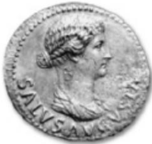
Slika 2. Portretni novčić Livije Druzile 22. god. n. e. (preuzeto iz Burns, 2007, 23)