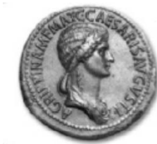
Slika 5. Portretni novčić Agripine Starije, koji je kovao njen sin Kaligula