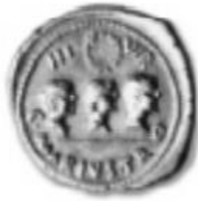
Slika 3. Portretni novčić Julije Starije sa sinovima Gajem (desno) i Lucijem (lijevo)