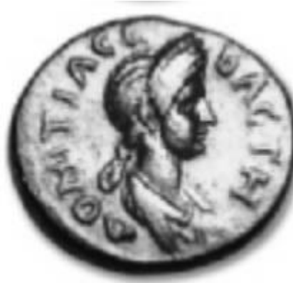
Slika 13. Domicija Longina na bronзанom novčiću (preuzeto iz Burns, 2007, 103)