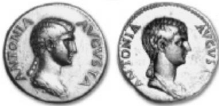
Slika 4. Dva posmrtna portretna novčića Antonije Mlađe (preuzeto iz Burns, 2007, 37)