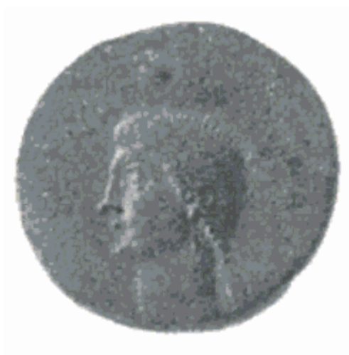
Slika 7. Portretni novčić Milonije Cezonije na novcu kralja Heroda Agripe I (preuzeto iz Vagi, 1999, 147)