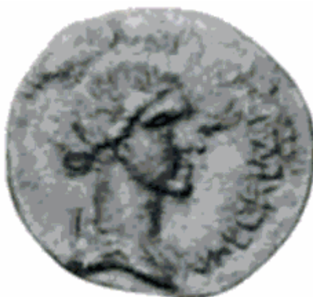
Slika 8. Portretni novčić Valerije Mesaline (preuzeto iz Vagi, 1999, 157)