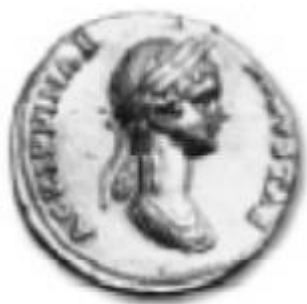
Slika 6. Portretni novčić Agripine Mlađe (preuzeto iz Burns, 2007, 50)