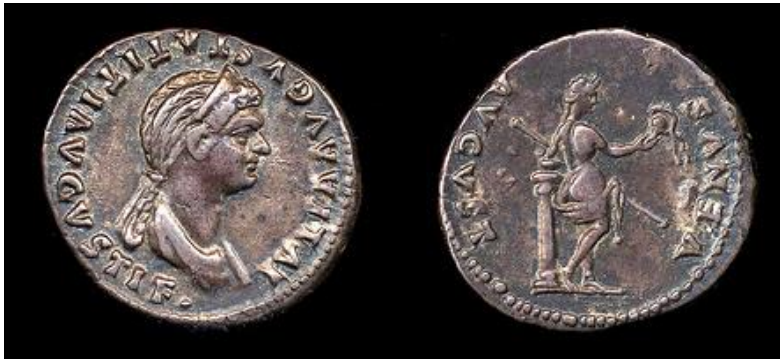
Slika 12. Portret Julije Flavije na srebrenom denarijusu (preuzeto sa https://finds.org.uk/romancoins/emperors/emperor/id/118 19. 07. 2020. 13:19)