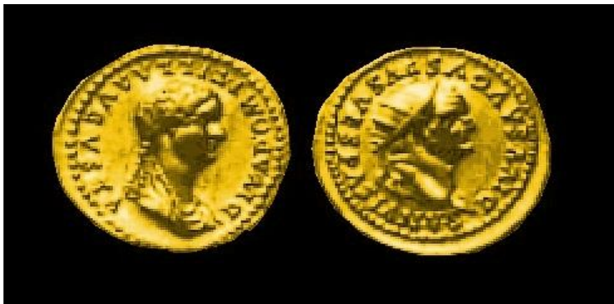
Slika 10. Flavija Domicila na Vespazijanovom aureusu