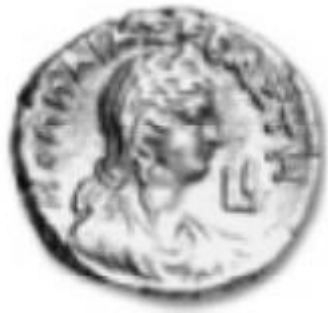
Slika 9. Portretni novčić Popeje Sabine (preuzeto iz Burns, 2007, 82)