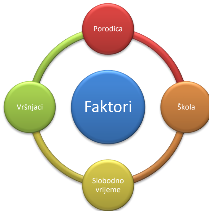
Shema 1. Osnovni faktori (agensi, prenosnici) socijalizacije

U svakom od primarnih faktora, potrebno je pronaći one koji su rizični za razvoj i nastanak ponašanja koje je u sukobu sa zakonom. Na neke od faktora rizika, treba posebno obratiti pažnju, a neki od njih su (Radetić Lovrić, Ninković, 2017):