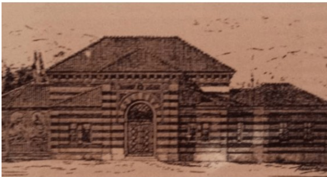
Slika 1. Sarajevska kiraethana: Nedžad Kurto, Arhitektura Bosne i Hercegovine: razvoj bosanskog stila , Sarajevo 1998. 67