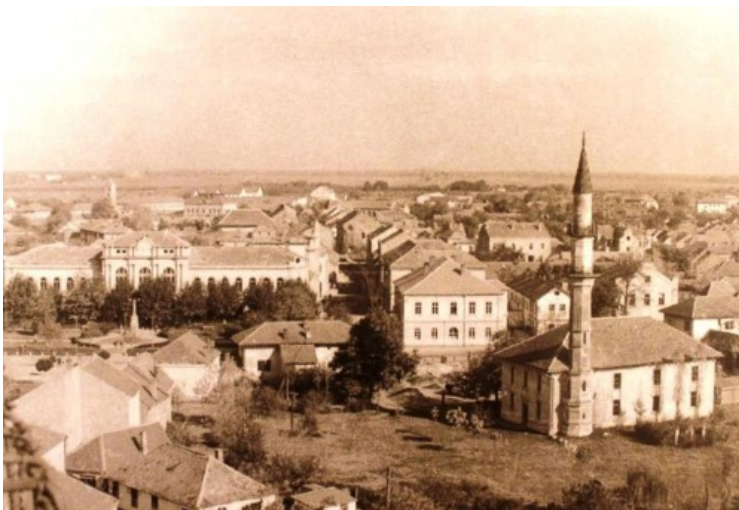
Slika 5. Islamska kiraethana u Bijeljini na desnom uglu prema haremu džamije Sultan Sulejmana 92

povjerenstva u Sarajevu, op. a.) na odobrenje predloži. Kiraethansko društvo je prvobitno, svojim sredstvima izgradilo polovinu zgrade u kojoj je smještena čitaonica, sa pravom uživanja na deset godina, da bi naknadno izgradilo i drugu polovinu, sa pravom korištenja od deset godina. Već 21. oktobra 1903. godine Vakufsko povjerenstvo je izvijestilo Zemaljsku vladu o zaključku vezanom za ustupanje zgrade kiraethanskom društvu, sa molbom da se navedeni zaključak odobri. Izgradnja zgrade, sredstvima kiraethane, govori o dobroj organizovanosti i djelovanju pomenute čitaonice. Naime, u tom periodu, pa i znatno kasnije, mnoge druge čitaonice su, za razliku od pomenute, koristile uglavnom neuslovne, iznajmljene prostorije za svoj rad.” 91