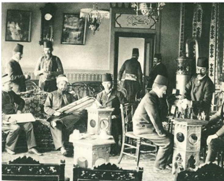
Slika 4. Muslimanska kiraethana u Rogatici 81