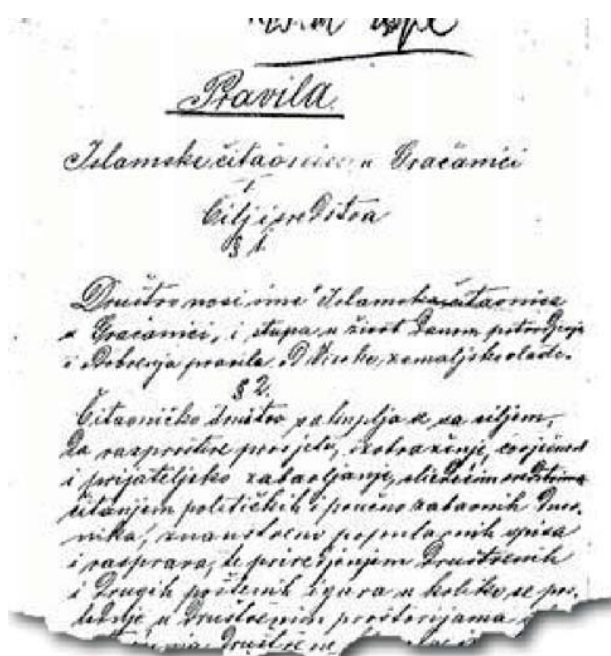
Slika 6. Pravila Islamske čitaonice u Gračanici 100

Tačan podatak o prestanku ove čitaonice nije dostupan, ali se zna da je 1924. godine tamburaška sekcija ove kiraethane i dalje bila aktivna. 99