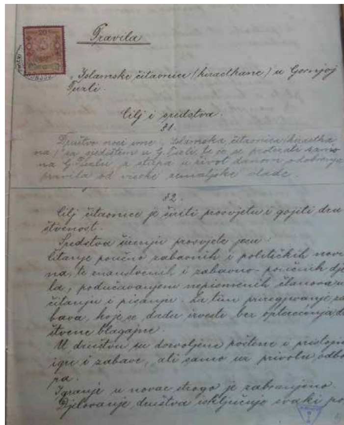
Slika 7. Prva strana pravila Islamske čitaonice u Gornjoj Tuzli 160