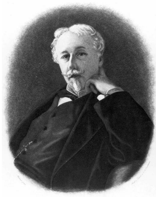
Slika br. 5. Joseph Arthur Gobineau (1816 – 1882): Slika preuzeta iz javnog domena sa: https://commons.wikimedia.org/wiki/File:Arthur_de_Gobineau.jpg#/media/File:Arthur_de_Gobineau.jpg

(1853 – 1855.). 93 Bio je član aristokratske francuske porodice, te je vjerovao da sudbinu civilizacija određuje njihov rasni sastav. Slavio je navodnu superiornost Arijevaca ili sjevernih Evropljana, uključujući Nijemce i tumačio je pogubljenje i protjerivanje aristokrata tokom Francuske revolucije kao oduzimanje Francuskoj njene najsposobnije vođe. Kao rezultat toga, smatrao je da je Francuska osuđena da izgubi svoju nacionalnu nadmoć u Evropi. 94