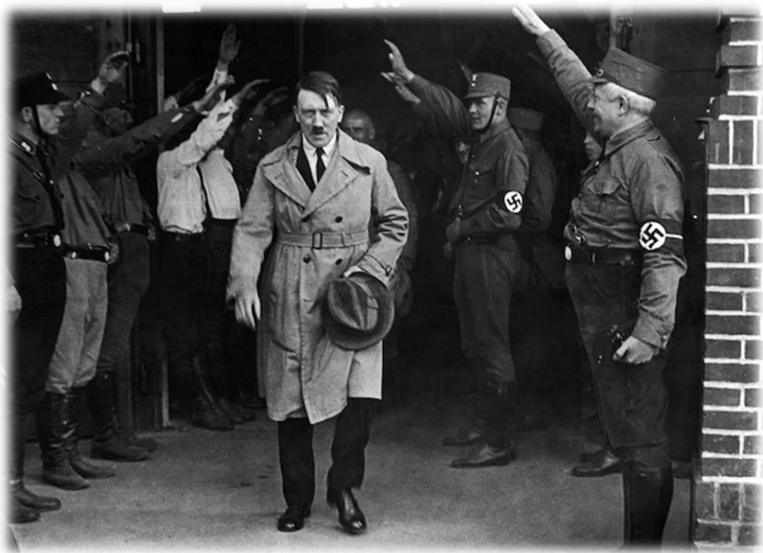
Slika br. 8. Adolf Hitler (1889 – 1945.)

namjerno planirali miješanje između Arijsaca i inferiornih rasnih grupa kako bi potkopali njemački dio. Ova rasna logika je bila ilustrovana Hitlerovim tumačenjem okupacije Rajne kao zavjere da bi se oslabila njemačka rasna suština. Jevreji su doveli crnce u Rajnsku oblast kako bi uništili omraženu bijelu rasu, te da oni svoju krv čuvaju čistom, a tuđu truje. 108