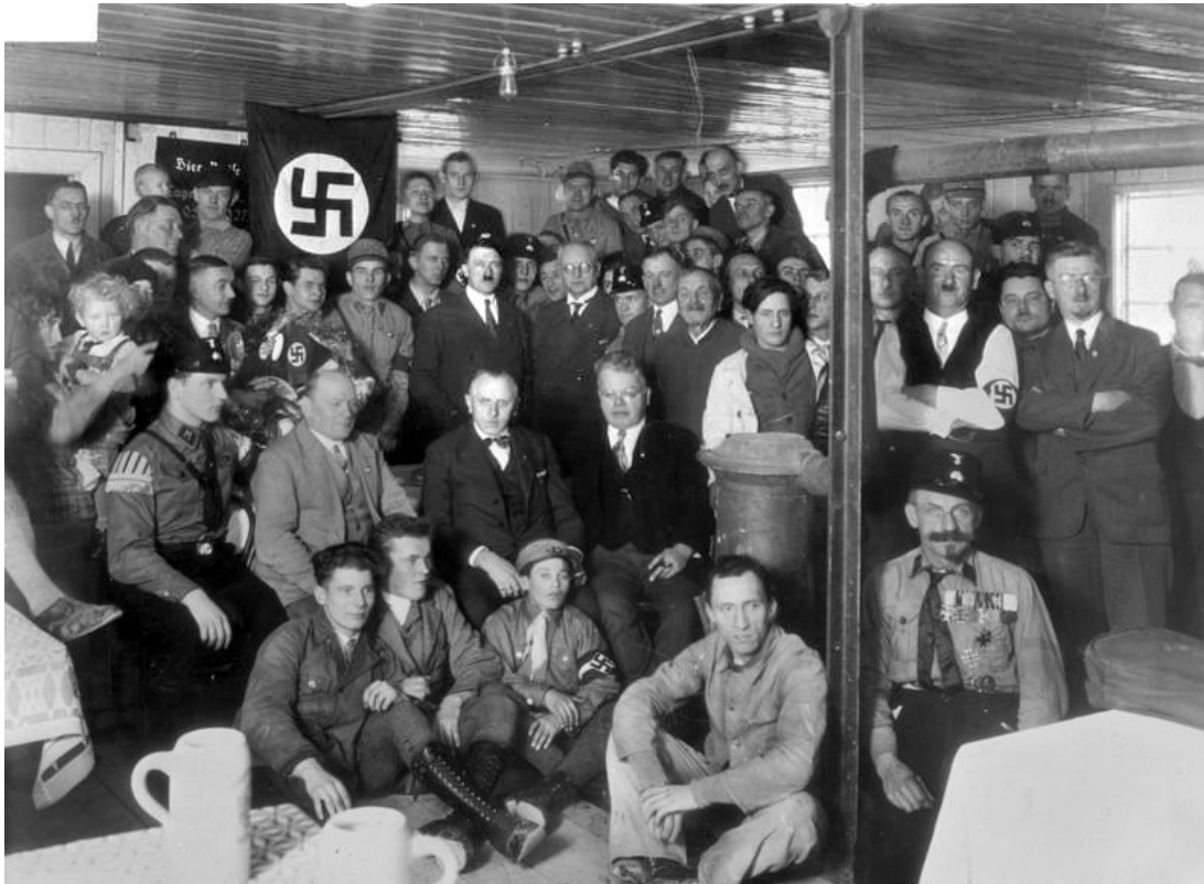
Slika br. 9. Članovi nacionalsocijalističke stranke (1930.): Slika preuzeta iz javnog domena sa: https://hr.wikipedia.org/wiki/Datoteka:Bundesarchiv_Bild_119-0289, M%C3%BCnchen, Hitler bei Einweihung %22Braunes Haus%22.jpg

korištena u nacističkoj Njemačkoj takođe je formirala elementarni okvir za arheološka istraživanja širom svijeta. 109