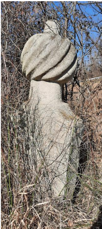
Slika 7: Esnafski nišan

Jedan je od nišana koji se ističe na mezarju na Karauli je (najvjerovatnije) esnafski nišan (Slika 7), iako je u odnosu na ostale nišane njegova klesarska izrada skromnija. Oblik ovog nišana sličan je nišanima trgovaca, koji su isklesani u gužvu i „bez prevoja preko turbana“. 42 Iz razloga što se oblik ovog nišana tipološki pridružuje grupi esnafskih nišana, 43 vjerujem da je preminuli bio zanatlija. Nažalost, ovaj nišan nema dodatni ukras koji bi pomogao odgovoriti na pitanje kojem esnafu je zanatlija pripadao.