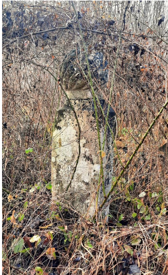
Slika 22: Esnafski nišan

Prvi nišan na koji se naišlo (Slika 22) po svom tipu pripada grupi esnafskih nišana. Obzirom da je nišan obrastao u šipražje, nije mu bilo moguće prići u potpunosti, što ograničava mogućnost detaljnijeg opisa i analize. Na tijelu nišana nisu uočeni ornamenti niti epitafi, što upućuje na njegovu osnovnu funkciju kao oznaku grobnog mjesta bez dodatnih dekorativnih elemenata. Takođe, nedostatak ornamenata može ukazivati na to da je nišan pripadao nižem esnafskom sloju, čije članove nisu smatrali potrebnim za dodatnu ukrašavanje. Za potpuniju identifikaciju i razumijevanje ovog nišana potrebno je obaviti dodatna istraživanja i čišćenje okoline.