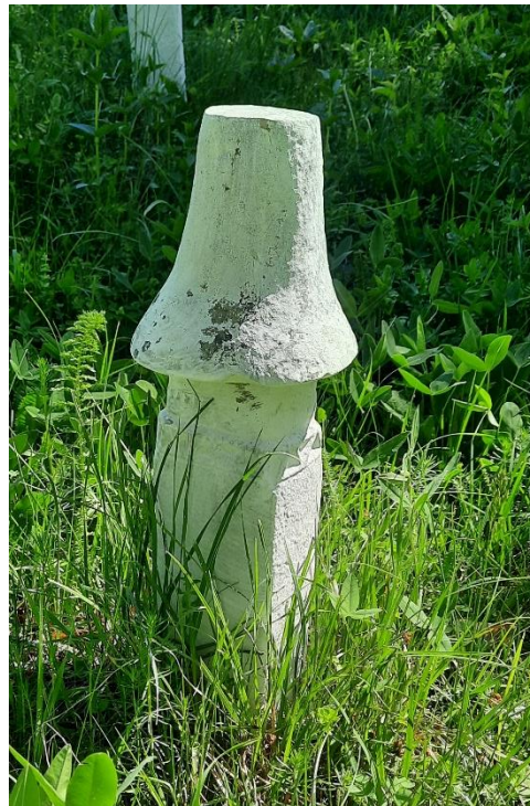
Slika 42: Ženski nišan s turbanom oblika „šešira“