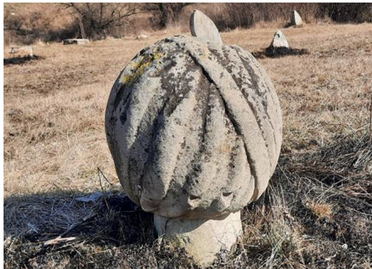
Slika 9: Nišan trgovca ili ugledne osobe