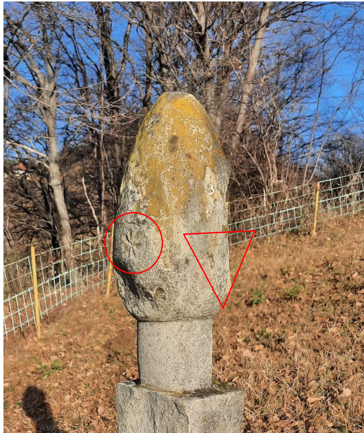
Slika 21: Derviški nišan s označenim motivima na kapi

U sjevernom dijelu mezarja nalazi se derviški nišan (Slika 21). Njegova visina iznosi 1,15 metra. Iako su na tijelu i glavi nišana primjetna oštećenja, prema obliku kape ovaj nišan tipološki se može odrediti kao nakšibendijski. Motiv rozete vidljiv je na kapi nišana, ali i motiv obrnutoga trougla s kosim linijama koji se nazire kod oštećenog dijela dijela glave nišana. Prema pojedinim tumačenjima trokut u sufizmu označava tri tačke koje simbolizuju Boga, početak svijeta i kraj svijeta. Prema oblicima nišana mezarje se može datirati u 16. ili 17. stoljeće.