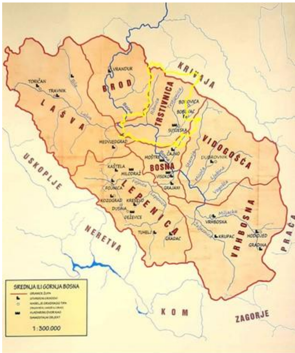
Karta 1: Prikaz najstarijih župa sa usporedbom današnjih granica općine Kakanj (označena žutom linijom)