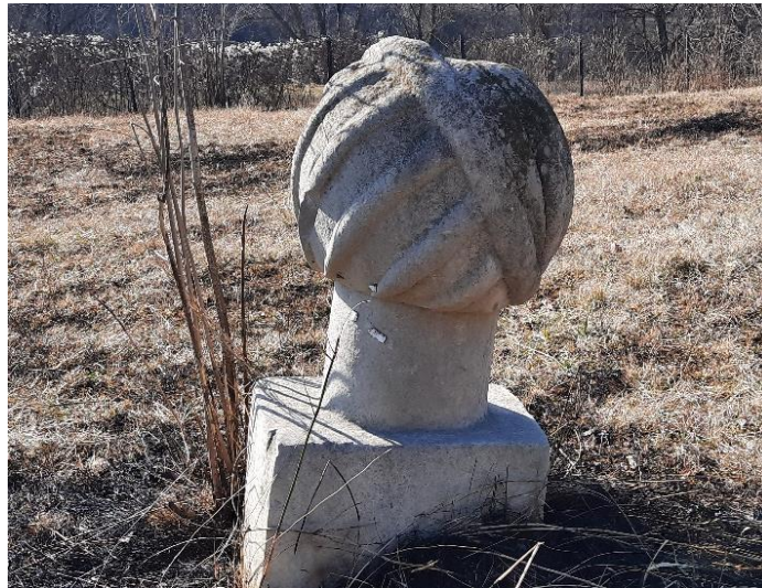
Slika 8: Nišan trgovca ili ugledne osobe

Pored navedena dva nišana, na lokalitetu je evidentiran jedan ženski i nekoliko nišana trgovaca. U literaturi se nišani trgovaca nazivaju i nišanima uglednih osoba, koji se od esnafskih nišana razlikuju po tome što imaju prevoj preko gužve. Na ovoj nekropoli nalazi se šest takvih nišana. Dva nišana (Slika 8 i 9) plijene pažnju zbog većeg turbana promjera oko 30 centimetara. Oba nišana su utonula u zemlju, ali je još uvijek vidljiva lijepa klesarska izrada. Analizom izgleda nišana, kao i analizom klesarske izrade ovi nišani se datiraju u 16. ili 17. stoljeće.