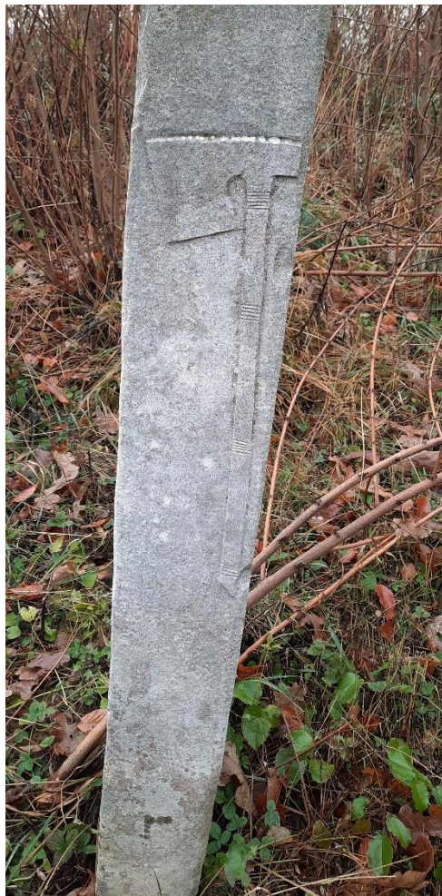
Slika 32: Prikaz motiva sjekire

Nedaleko od navedenih nišana, na blago uzdignutom terenu, nalaze se stari nišani obrasli u gusto i teško pristupačno rastinje. Među nišanima ovog dijela mezarja je i nišan za kojeg Muhamed Kreševljaković smatra da je najstariji. Nišan je oblik stela (Slika 33), na čijem se gornjem dijelu nalazi natpis oivičen kvadratnim okvirom. Ono što plijeni pažnju je lijepo kaligrafski oblikovan tarih na nišanu. Devijacije i pretjerano estetiziranje slova čine tekst teško čitljivim, ali bi se mogao pročitati kako slijedi: „ Al Magfur bin Hako (?), 6 redžeb (?) 985 sene “,