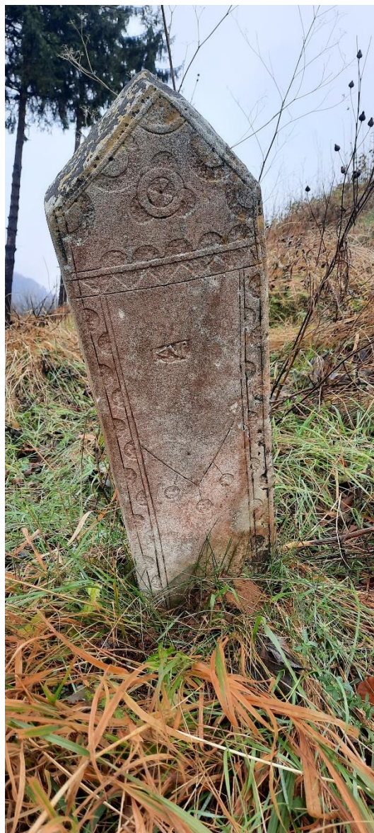
Slika 37: Prikaz bogato dekorisanog ženskog nišana