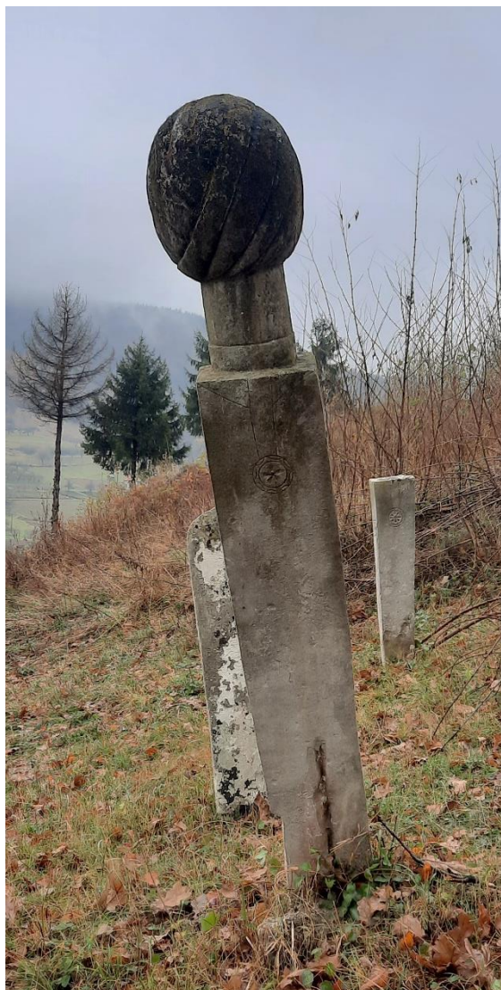
Slika 30: Nišan ugledne osobe