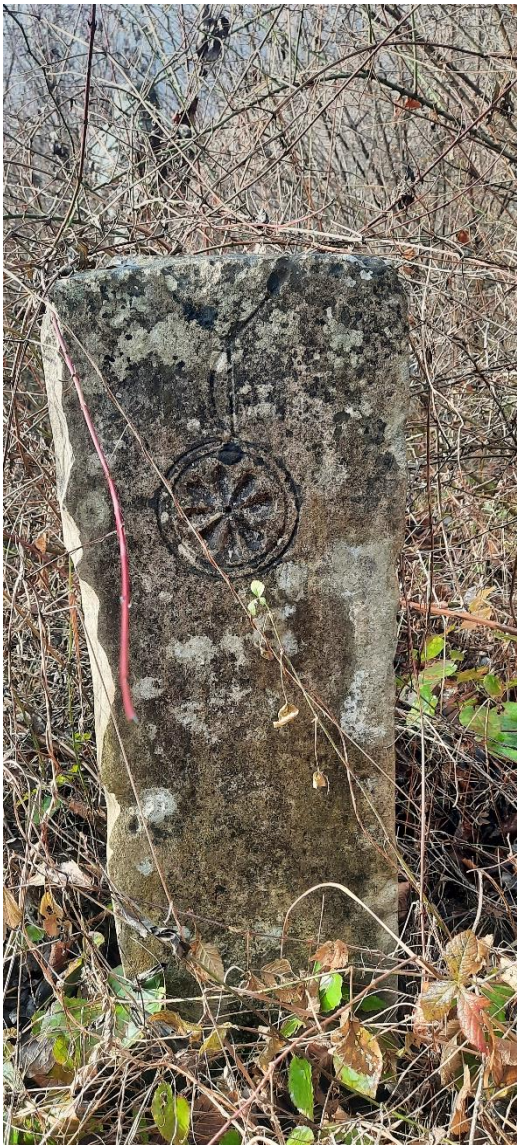
Slika 23: Nišan s prikazom rozete

Drugi nišan (Slika 23) nažalost, nije imao turban. No, na tijelu je imao lijepo isklesanu osmolisnu rozetu upisanu u dvije kružnice, koja je povezana s jednom linijom raščlanjenom na dvije pri samom vrhu tijela, odnosno dijelu gdje se nastavlja vrat nišana. Koristeći malo mašte, može se zaključiti da je riječ o ogrlici čiji ukras je rozeta. S bočne strane ovog nišana (Slika 24) uočen je motiv noža, čija drška na vrhu ima krug sa zupčastim završecima. Oštrica mu je blago zakrivljena, asocirajući na sablju, ali kako je kratka očigledno da je riječ o nožu, a ne o sablji.