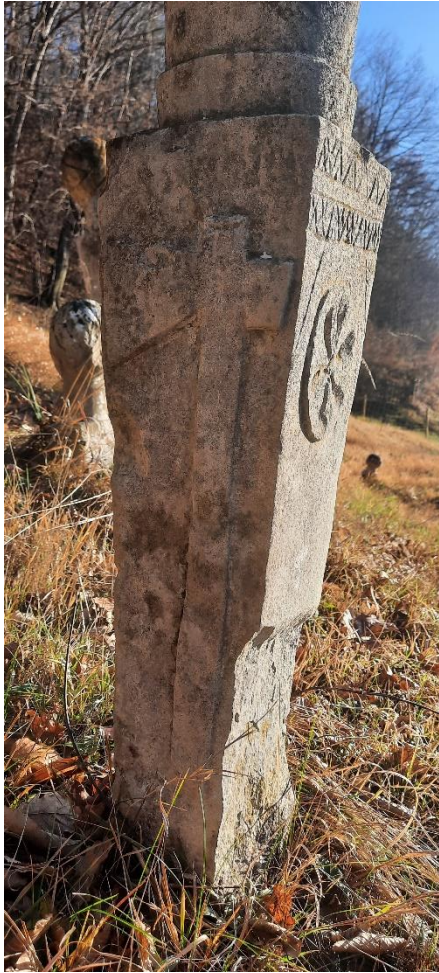
Slika 18: Nišan s prikazom motiva sjekire, rozete i cik-cak linija