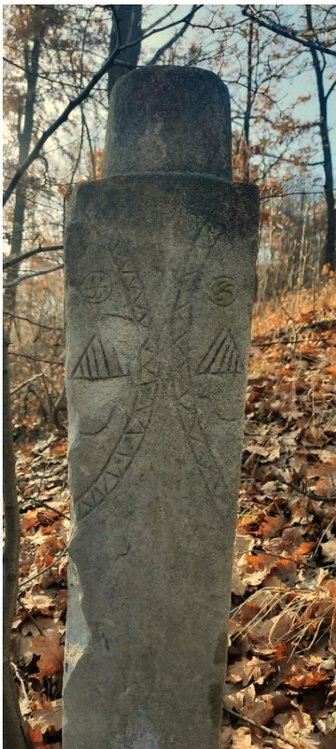
Slika 14: Derviški nišan

Prilikom obilaska terena turbe je bilo zaključano, tako da nije bilo moguće kazati nešto više o njegovoj unutrašnjosti. Iako su prozori turbeta zaštićeni demirima (željezne rešetke), moguće je vidjeti kuburu (mrtvački sarkofag), bašluk i ajakluk. Uzglavni nišan, to jeste bašluk, ima turban s gužvama i prevojem. Po tipu nišana, zaključuje se da je tu sahranjen muškarac.