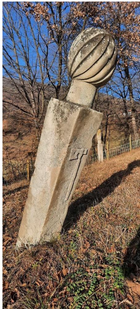
Slika 17: Nišan ugledne osobe s motivom sjekire (balt)