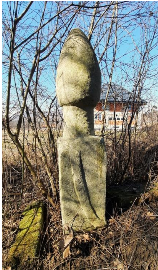
Slika 5: Derviški nišan

se motiv ruke može povezati s derviškim pozdravom. Derviši vjeruju da je jedini način nekoga zaista upoznati je povezivanje na nivou duše, što je razlog praktikovanja naročitog pozdrava koji se ogleda u nekoliko faza: a) prilazak jedno drugom, gledanjem u oči raširenih ruku, b) međusobno dodirivanje dlanova, dok i dalje gledaju jedno drugome u oči, c) podizanje i držanje ruku za 90°, dodirivanjem dlanova, a oči se potom zatvaraju, d) međusobno prave trougao s palčevima i kažiprstima, a potom slijedi “pogled u oči Boga”, e) desna ruka hvata lijevu ruku partnera držeći se uz srce, f) slijedi zagrljaj, srce k srcu, s desnom rukom koja prelazi preko lijevog ramena partnera i lijevom rukom oko leđa. 41