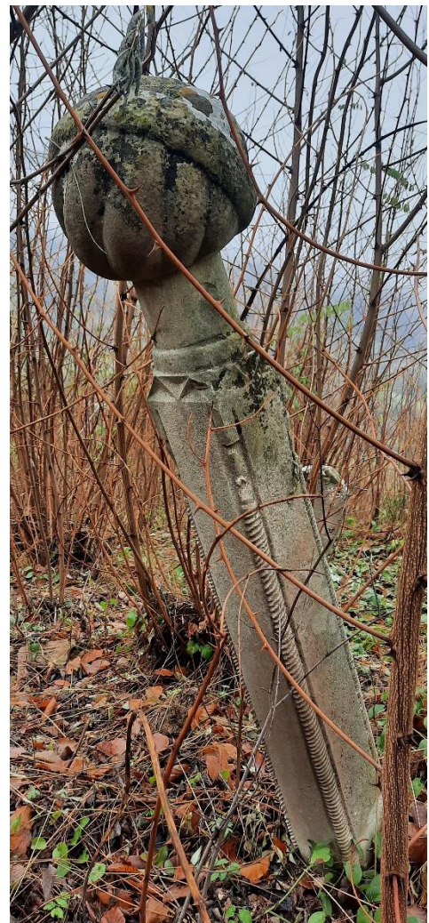
Slika 34: Nišan ugledne osobe s motivom uvrnute bordure