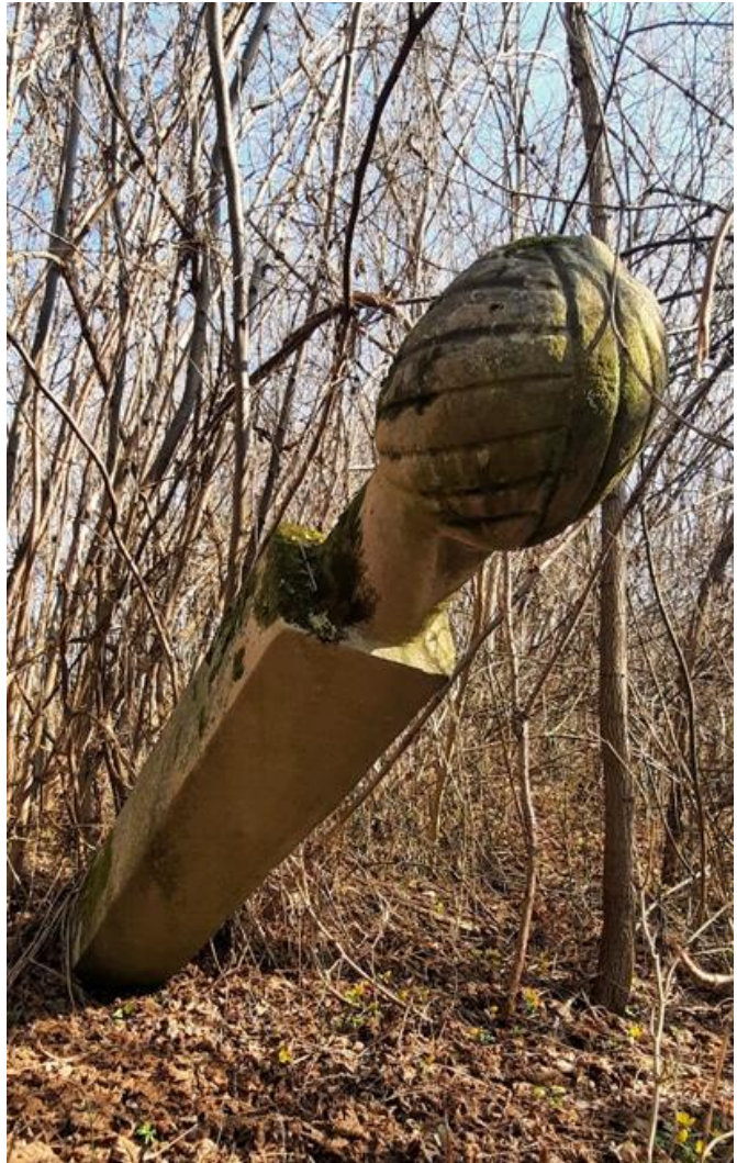
Slika 2: Muški nišan ugledne osobe