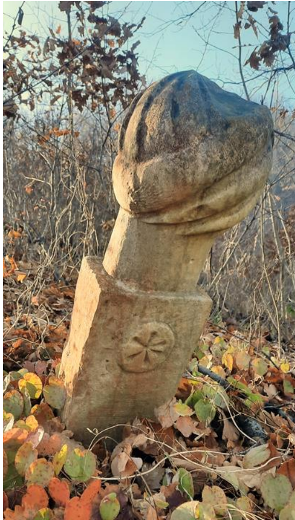
Slika 13: Nišan ugledne osobe s prikazom rozete

Preostala tri nišana, iako jednostavnija, nose tragove starine i istrošenosti, što ukazuje na njihovu dugovječnost. Mezarje je djelimično zaraslo u vegetaciju. Na nekoliko mjesta mogu se uočiti fragmenti oštećenih nišana, što svjedoči o dugom vremenskom periodu tokom kojeg su bili izloženi vremenskim neprilikama. U neposrednoj blizini nišana nalazi se nekoliko neoznačenih mezara, koji su vjerovatno pripadali članovima iste zajednice.