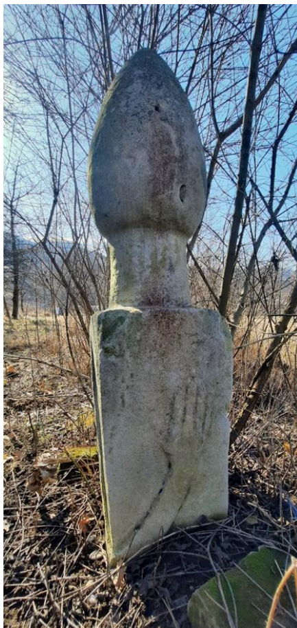
Slika 6: Prikaz motiva ruke na derviškom nišanu

Postoji još jedno moguće čitanje. Motiv ruke na nišanu se uspoređuje s derviškim plesom „sema“, koji predstavlja zikr (veličanje) Boga. Ples započinje tako što derviš ima prekrizene ruke na prsima, a potom se počinju okretati na jednom mjestu s desna na lijevo u smjeru srca. Zatim širi ruke tako da je desna ruka biva podignuta ka nebu spremna da primi Božiji blagoslov, a lijeva ka zemlji kao simbol darivanja. Raširene ruke derviša simbolizuju i derviški zagrljaj ljubavi. Značajno je spomenuti da i kapa koju nosi sufija tokom „sema“ označava grobni kamen iznad materijalnih užitaka, što je u biti svojevrsan nadgrobni spomenik egu.