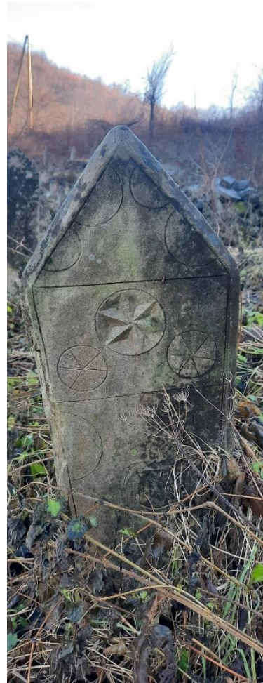
Slika 29: Ženski nišan