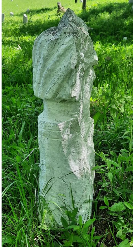
Slika 40: Esnafski nišan