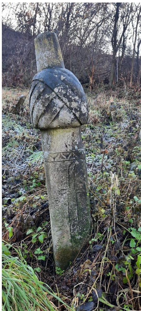
Slika 26: Prvi nišana s prikazom sablje

Nekoliko muških nišana na ovom mezarju ima neuobičajene motive u vidu horizontalnih i vertikalnih linija sa tačkastim udubljenjima pri dnu. 60 Ovakav vid ukrasa zabilježen je i na nekropoli Popržena Gora, o čemu će kasnije biti riječi. Mezarje i nišani na lokalitetu Čista datiraju se od 18. stoljeća do danas.