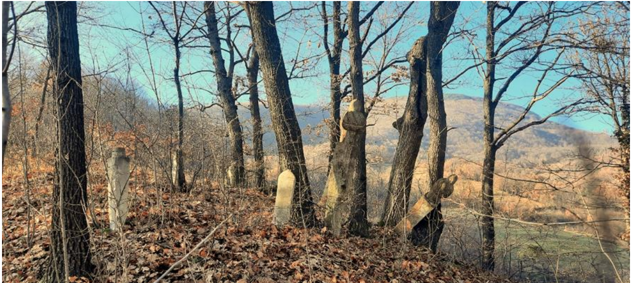
Slika 12: Prikaz kompletne nekropole nišana

„Između sela Groca i Ribnice je mesto Turbe. Tu su se isekli svatovi. I sada stoje nišani od nekoliko mezara, a turbe je oboreno“, 48 ovim riječima Milenko Filipović donosi jedini zapis o ovom lokalitetu. Na brežuljku su smješteni stari nišani i turbe koje je obnovljeno, a današnji put razdvaja turbe od nišana. Groblje broji šest nišana (Slika 12) od kojih se tri tipološki mogu odrediti kao „nišani uglednih osoba“. Na prvom nišanu (Slika 13) nalazi se motiv uklesane šestolisne rozete u krugu, koji je sličan rozeti na nišanu iz Donjih Lučana. Druga dva nišana nemaju ukrase, ali njihova naročita visina privlači pažnju.