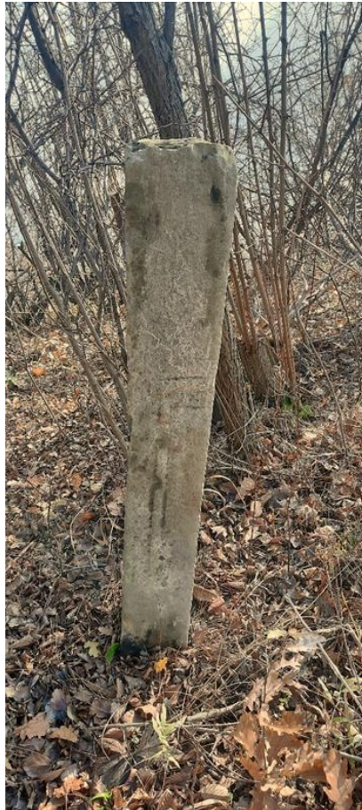
Slika 11: Nišan s prikazom sjekire

Nekih 20 metara od prvog nišana nalazi se drugi nišan (Slika 11) koji u plitkom reljefu ima isklesan motiv sjekire (balte). Nažalost, spomenik nema glavu, to jeste turban. Vrlo vjerovatno da je ovaj nišan imao sličan turban kao i prethodni.