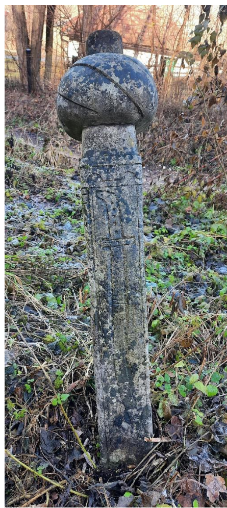
Slika 27: Motiv sablje s drugog nišana