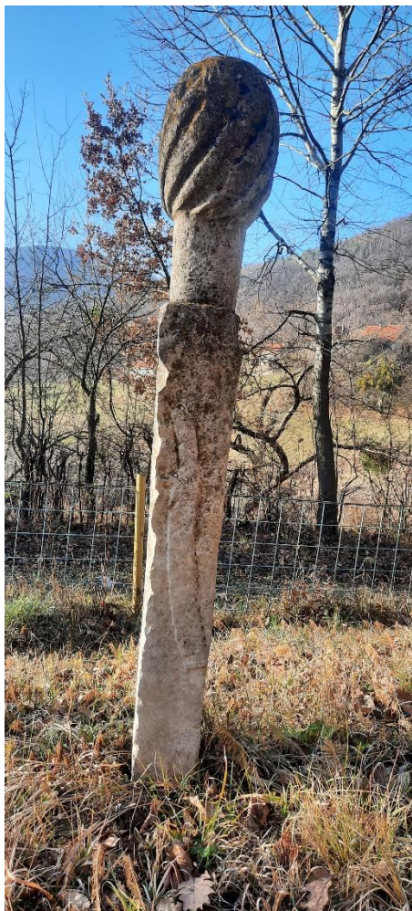
Slika 16: Nišan ugledne osobe s motivom sablje