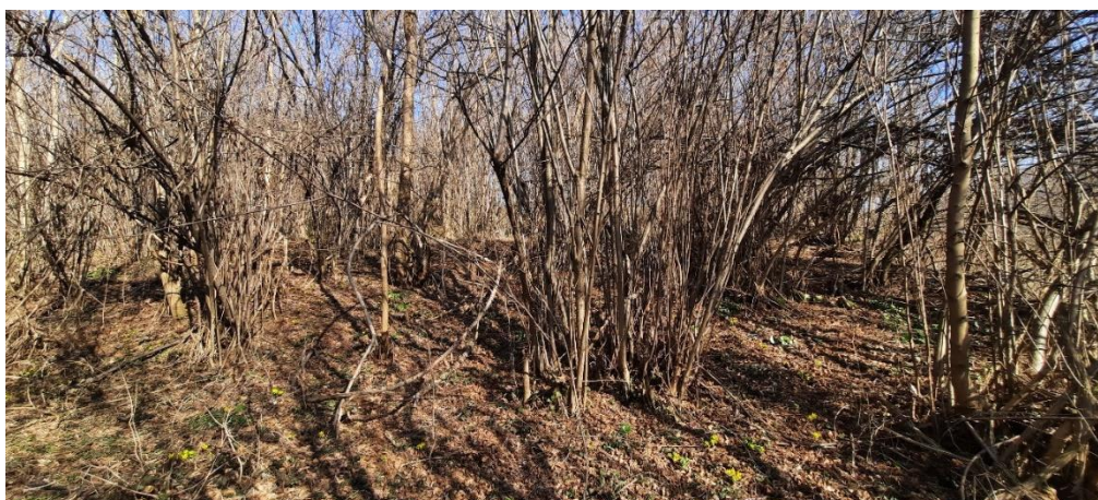
Slika 4: Zatečeno stanje nekropole nišana