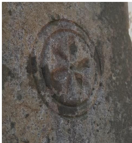
Slika 3: Prikaz rozete smještene u dvije kružnice