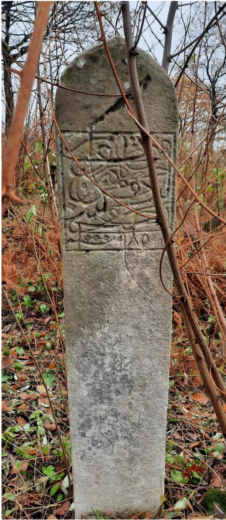
Slika 33: Nišan oblika stele s epitaforom

što u prevodu znači: „ Preminuli Džafer sin Hake (?) šestog redžeba (?) 1577. godine “. 62 Datiranjem nišana u drugu polovinu 16. stoljeća potvrđuje se pisanje Muhameda Kreševljakovića da se radi vjerovatno o najstarijem nišanu na ovom mezarju. Otprilike jedan metar od njega nalazi se nišan izuzetno fine obrade, s turbanom u gužve i prevojem te tordiranom trakom oko rubova tijela nišana (Slika 34). Kameni santrač okružuje oba nišana, ali se njegova linija gubi na sredini između njih, vjerojatno zbog erozivnog djelovanja tla.