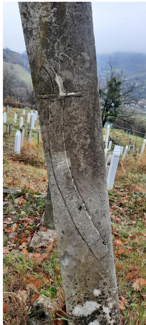
Slika 31: Prikaz sablje u korici