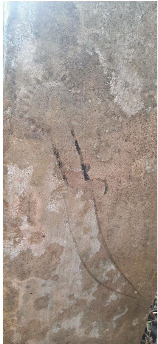
Slika 24: Prikaz motiva bodeža