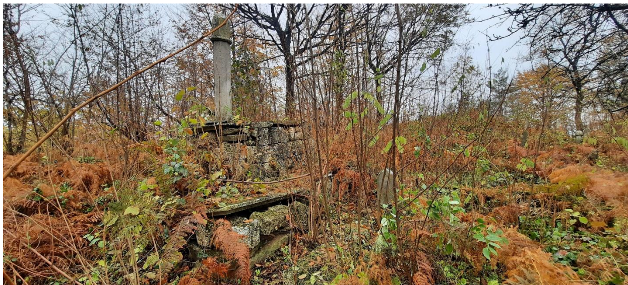
Slika 35: Prikaz dvije ozidane grobnice i derviškog nišana

Na ovom mezarju nalaze se spomenici sa sarkofagom zidanim sedrom. Jedna grobnica (Slika 35) sadrži nišan usađen u ploču, a po tipologiji riječ je o derviškom nišanu. Iznad i ispod ove grobnice nalazi se još sarkofaga od sedre prekrivenih pločom, ali bez nišana. Uz posljednju grobnicu nalazi se mezar oivičen santračem od sedre, ali samo s uznožnim nišanom. Grobnice sa sarkofazima smještene su u središnjem dijelu mezarja, čineći ih izdvojenim, što ukazuje na mogućnost da su preminule osobe imale značajnu ulogu u zajednici, zbog čega su dobile središnje mjesto na nekropoli. Zbog prisustva derviškog nišana sa sarkofagom, postoji mogućnost da su i ostali o mezari derviških ličnosti (nota bene: pored vjerskog i političkog utjecaja, derviši su također bili povezani s esnafskim organizacijama, što ukazuje na njihov neposredan utjecaj na zanatstvo, trgovinu i ekonomiju). 63