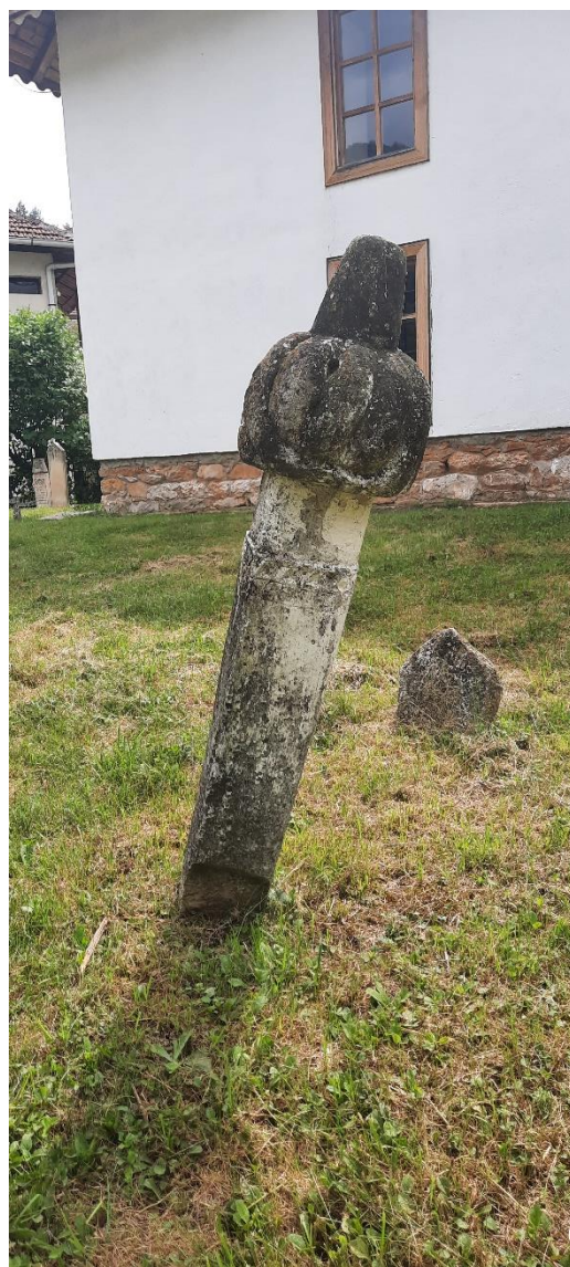
Slika 39: Nišan ugledne osobe