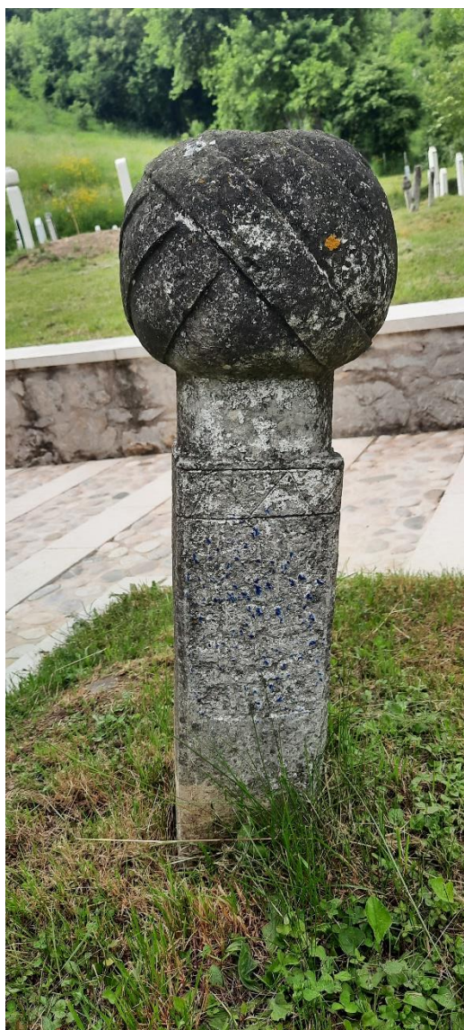
Slika 38: Muški nišan s epitafom

nekada se nalazio kavuk . Uslijed atmosferalija natpis je skoro nestao. Zahvaljujući istraživačkom radu Emira Demira iz 2020. godine, koji je zabilježio i preveo tarih, znamo da je tu ukopan imam Mustafa koji je preselio 1178. godine po hidžri, odnosno 1764. godine. 69 Drugi nišan (Slika 39) također po tipu pripada uglednoj osobi, ali ne sadrži tragove tariha. Na prelazu tijela nišana ka vratu nalazi se dupli motiv stalaktita. Na vrhu turbana nalazi se kavuk .