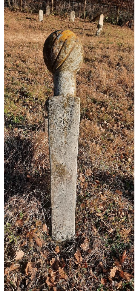
Slika 19: Nišan s prikazom rozete