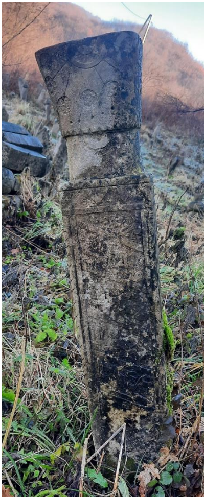
Slika 28: Djevojački nišan