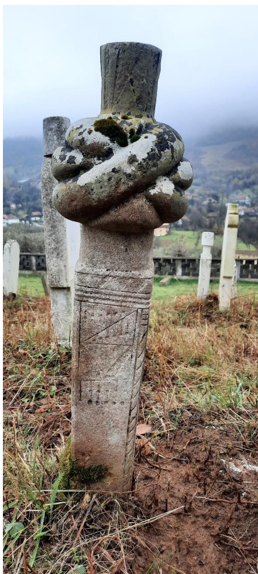
Slika 36: Muški nišan s prikazom kompozicije

moguće da ovi motivi predstavljaju dijelove nošnje ili nakita preminulog. Bogato ukrašeni ženski nišan u obliku stele (Slika 37) nalazi se u neposrednoj blizini ranije spomenutog muškog nišana. Prikaz ogrlice s dukatima i geometrijskih uzoraka na ovom ženskom nišanu sugerira da je preminula imala viši društveni status za života. Moguće da je ovdje riječ o supružnicima koji su ukopani u neposrednoj blizini.