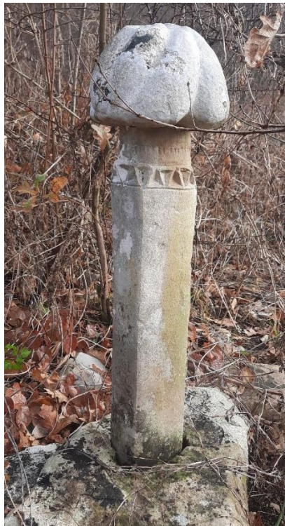
Slika 25: Usađeni nišan

Kada je riječ o Skupini 3, utvrđeno je nekoliko oborenih i uspravnih nišana. Iako je i ovo groblje obraslo u gustu vegetaciju, uočen je zanimljiv nišan usađenog u kamen (Slika 25). Na turbanu se nalaze gužve koje asociraju na gljivu. Na vrhu se nalazio kavuk . Pojam kavuk označava vrh završetka turbana koji može biti urađen i od vertikalnih linija – mudževéz , 57 koji označava viši društveni položaj. Navedeni nišan ima dekoraciju u obliku mukarnsana (trouglova), koji prema tradiciji označavaju mezar osobe koja je obavila hadž.