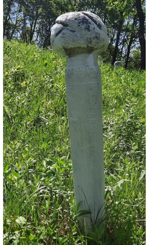
Slika 41: Nišan ugledne osobe s prikazom sablje