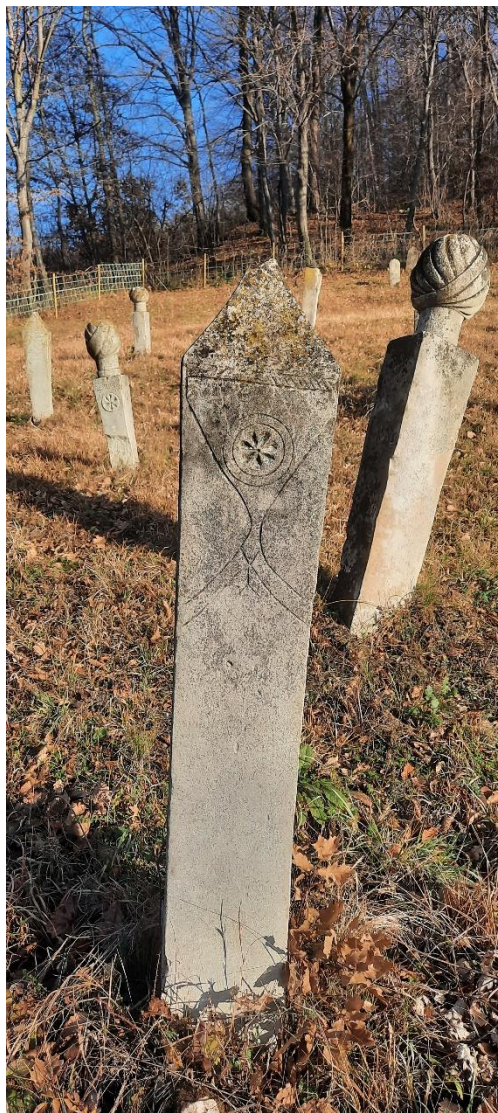
Slika 20: Nišan konusnog oblika

Od navedenih nišana izdvajaju se dva nišana – nišan s piramidalnim završetkom i derviški nišan. Nišan konusnog oblika (Slika 20) zanimljiv je zbog motiva koje sadrži, odnosno prikaza derviškog prsluka (džube). U središnjem dijelu motiva džubeta je rozeta upisana unutar dva kruga, dok se na tijelu nišana i njegovom vrhu pojavljuje motiv trake ukrašene kosim linijama. U većini slučajeva ovakav oblik nišana smatra se da je podignut ženama, ali ga je također moguće povezati i s prethodno spomenutim nišanom i reći da je to uznožni nišan (ajakluk), jer nalazi u ravnini s prethodnim nišanom. Obzirom da nisu uočeni epitafi, o nišanu s piramidalnim završetkom ne može se nešto više reći.