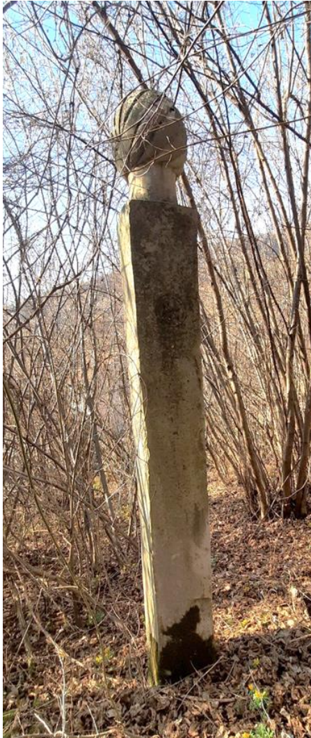
Slika 1: Nišan I