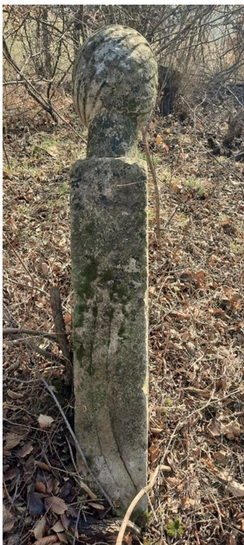
Slika 10: Nišan s prikazom sablje