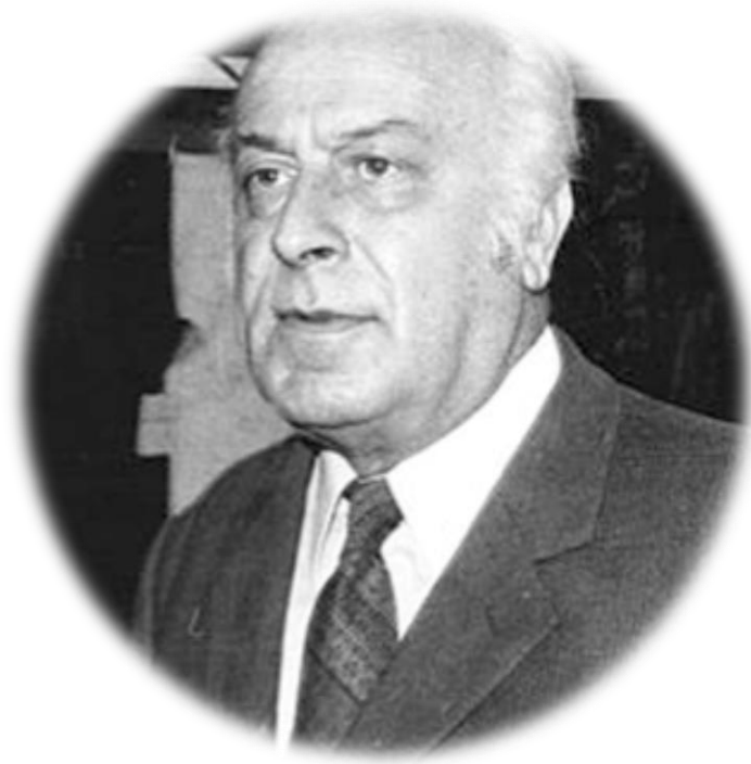
Skender Kulenović (1910-1978)

Skender Kulenović je rođen 1910. u Bosanskom Petrovcu. U rodnom mjestu završio je osnovnu školu, gimnaziju u Travniku, a Pravni fakultet je studirao na zagrebačkom Sveučilištu. Učesnik je narodnooslobodilačke borbe od 1941. godine. Biran je i za člana AVNOJ-a. U toku narodnooslobodilačke borbe uređivao je partizanske listove, a po okončanju rata bavio se političkim radom i uređivanjem listova i časopisa. Bio je dopisni član Jugoslovenske akademije znanosti i umjetnosti u Zagrebu i redovni član Srpske akademije nauka i umjetnosti. Umro je u Beogradu 1978. godine.