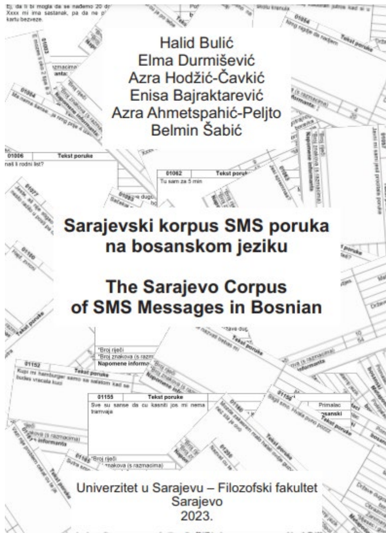
Izgled naslovne stranice Korpusa

Sarajevski korpus SMS poruka na bosanskom jeziku sadrži 10.000 poruka. On je rezultat projekta Centra za bosanski, hrvatski i srpski jezik Univerziteta u Sarajevu – Filozofskog fakulteta. Rad na Korpusu trajao je od januara 2021. do jula 2023. godine. Sarajevski korpus SMS poruka na bosanskom jeziku izvorno je objavljen kao elektronska knjiga. 15 Potom su podaci iz njega digitalizirani, prilagođeni modernim konkordanserima i alatima za pretragu i kao elektronski korpus postavljeni na repozitorij CLARIN.SI ( Slovene Common Language