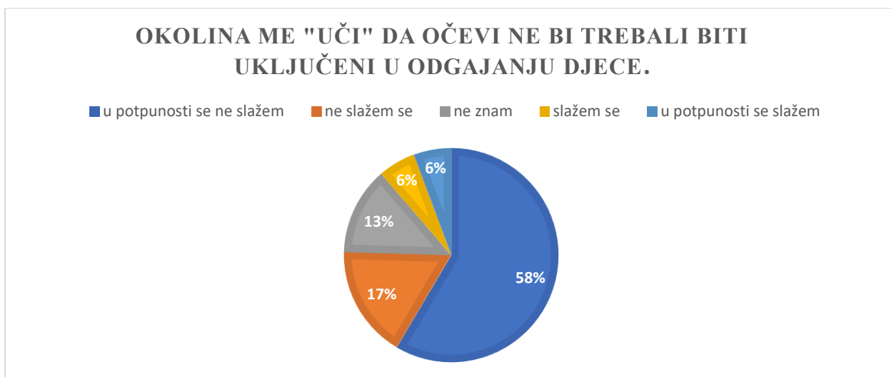
Dijagram 3. Prikaz tvrdnje o uticaju okolinskog faktora

Dijagram 2. označava stavove očeva u vezi izazova i barijera u uključenosti u odgoj djece. Većina očeva (N=28) slaže se sa tvrdnjom da prisutnost stereotipije o muškoj ulozi predstavlja jednu od barijera u uključenosti. 16 sudionika navodi kako se u potpunosti ne slaže sa ovom izjavom dok je 24 njih označilo tvrdnju sa “ne znam”. Autor knjige “Biti otac, biti muškarac”, Jesper Juul (2020) govori kako u današnjem vremenu nestaju tradicionalne uloge, odnosno, razlike između muškaraca i žena nisu više toliko jasne kao prije nekoliko generacija, pa se zato obrasci reagovanja muškaraca i žena ne mogu više definisati s obzirom na pol.