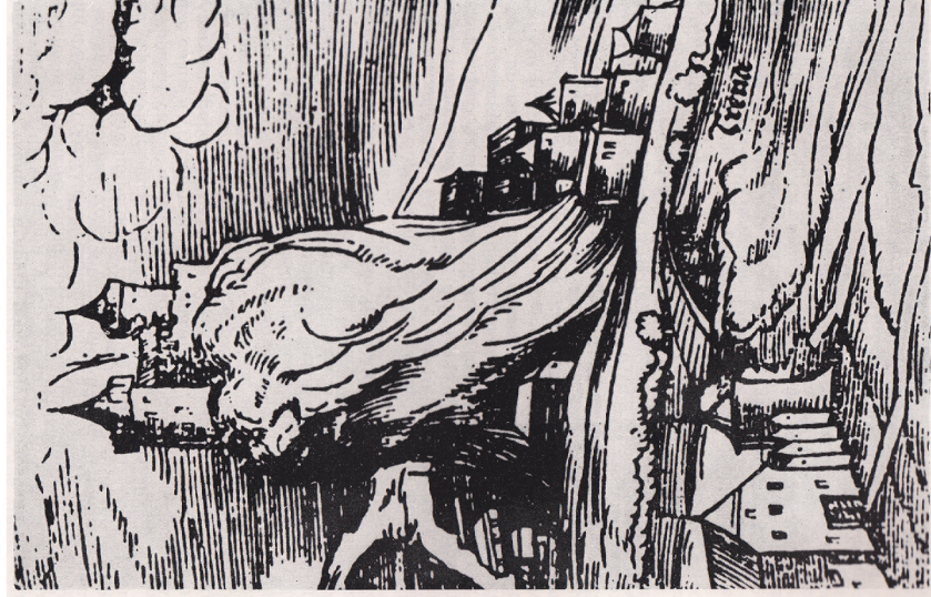
Slika br. 1. Višegrad, grafi ki prikaz preuzet iz Kuripešićevog putopisa iz 1530. godine

Porijeklo imena grada pak ostalo je do danas nerazriješeno. Složenica Višegrad , sastavljena od prefiksa viši i rije i grad , sasvim sigurno je slavenskog porijekla, i ova- kav naziv gradova prisutan je na širem podru ju koje naseljavaju Slaveni. 21 Me u- tim, s obzirom na zna enje, postavlja se pitanje kako je grad dobio ime. Najnoviji pogled na ovo pitanje dao je Aleksandar Loma, koji smatra da zbog prefiksa viši , koji je ustvari komparativ pridjeva, nizvodno od Višegrada treba tražiti zna ajniji grad sa starijom historijom u odnosu na iji bi položaj Višegrad bio viši . 22 injenica da nije utvr eno postojanje takvog grada njegovu teoriju ini neuvjerljivom. Po svemu suděci, Višegrad je, kao i svi ostali poznati gradovi istog naziva na podru ju koje naseljavaju Slaveni, dobio ime na osnovu svog odnosa prema rijeci iznad ije je obale sagra en. U bosanskom slu aju to je rijeka Drina i to u blizini ušća Rzava u Drinu.